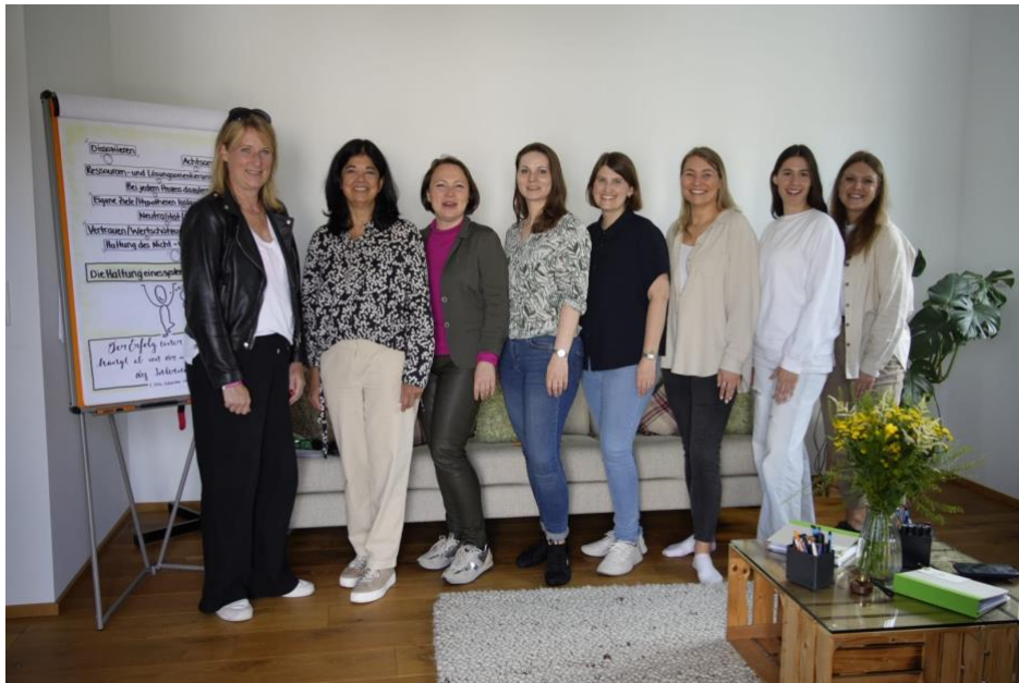
Aufnahme: Gruppe 2024-2025